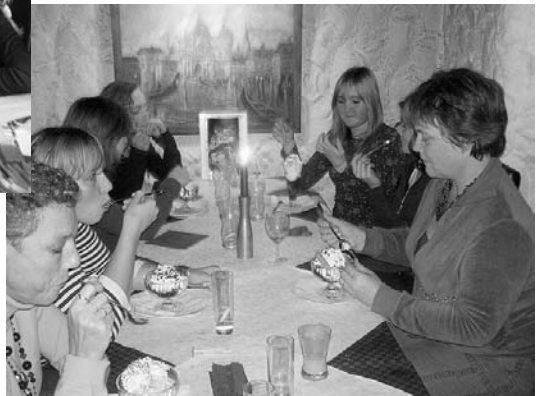
Etentje als afscheid van de "oude" Jeugdcommissie.